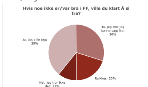
69% ville sagt i fra, eller tror de kunne sagt ifra hvis noe ikke er/var greit i FF. 20% er usikre